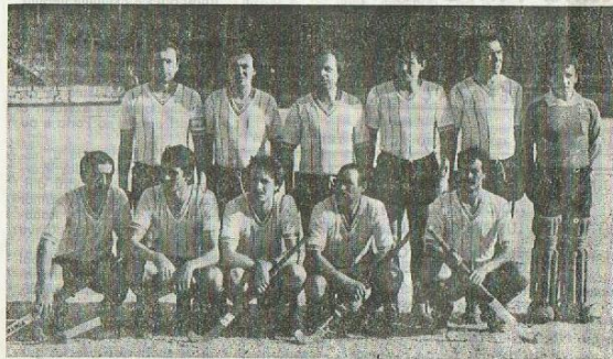
Esta uma das equipas que alinhou no Campeonato Nacional