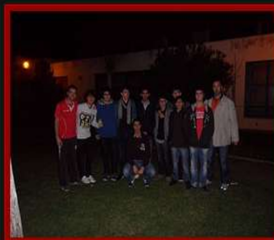
Jovens Lousadenses em frente ao Pavilhão Intel em Mirandela (04/12/11)