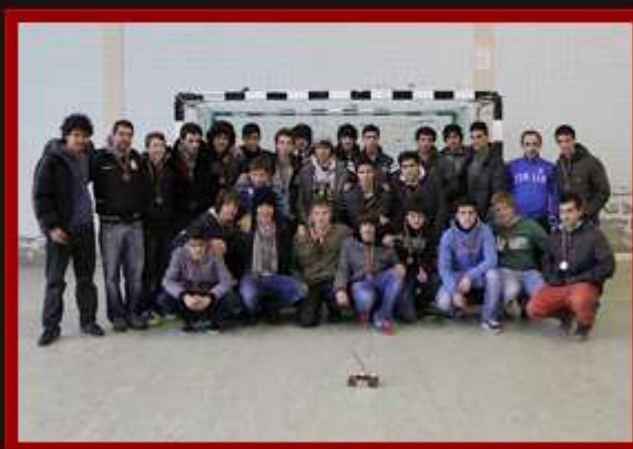
Atletas da ADL e C.A.MIR

http://www.facebook.com/media/set/?set=a.3082270058921039.64720.129569080424300&type=3