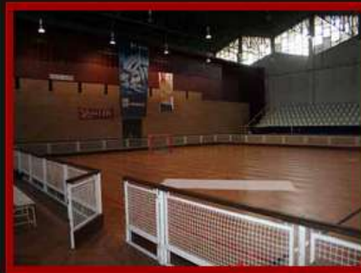
Infante de Sagres