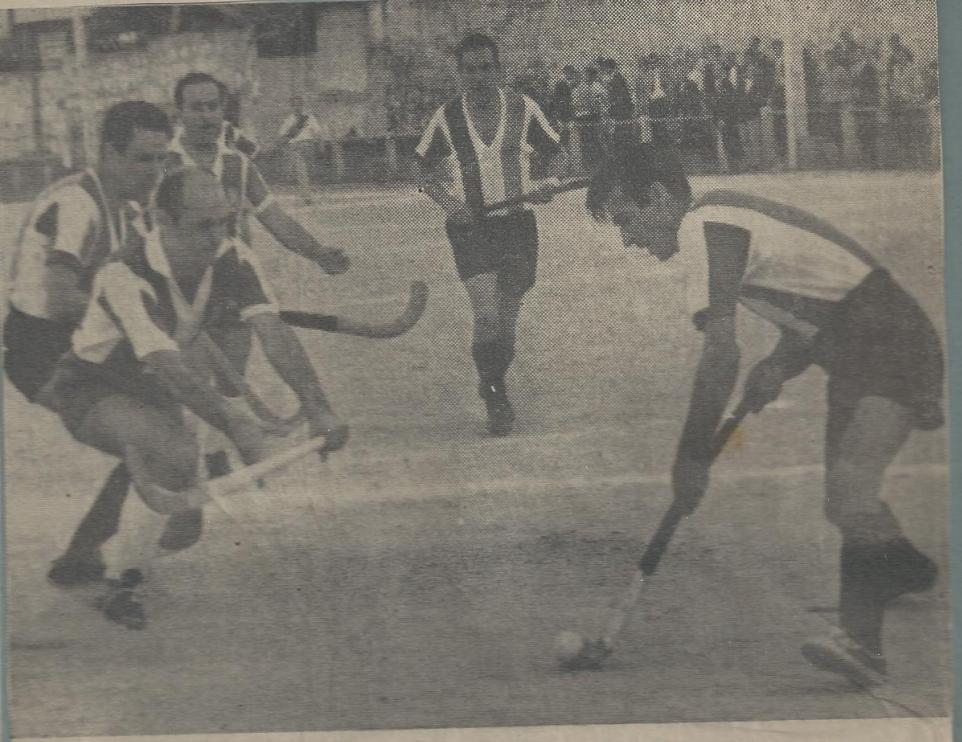
Jogada de ataque do Ramaldense que a defesa do F. C. do Porto tenta anular

Lamenta-se, entretanto, a pouca seriedade de determinados elementos que nem sempre evidenciaram a correcção devida. Por via disso, os árbitros tiveram-se obrigados a suspender temporariamente varias jogadores de ambas as equipas, facto que deu ao encontro uma desagradável.