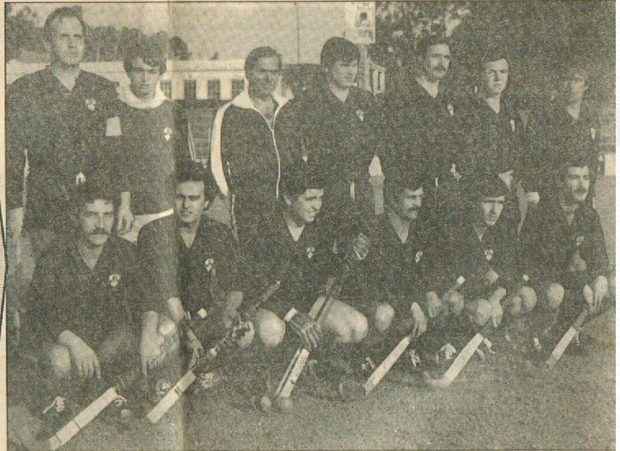
O União de Lamas tem atrás de si todo um passado de muita valia no hóquei em campo nacional, com algumas equipas de notável índice técnico. Outros muito fizeram para que a actual turma tenha atingido a final da Taça de Portugal...